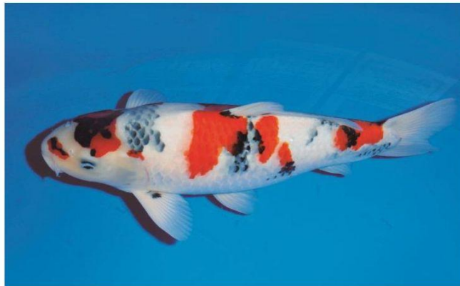
③ Vista Lateral Direita